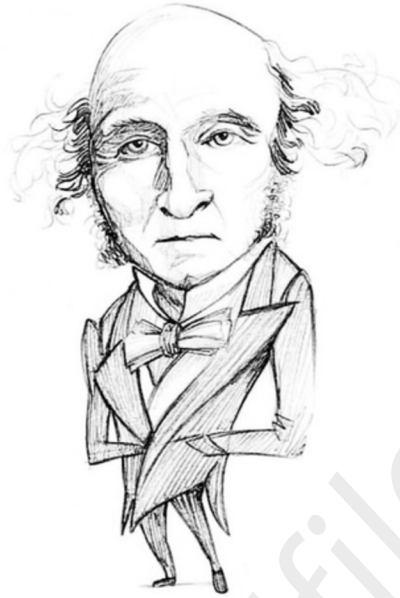
Ilustración: Nacho García.