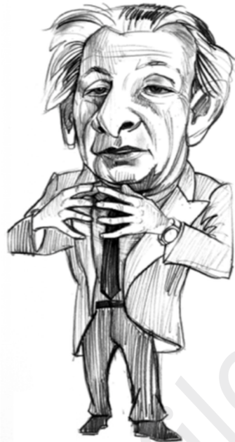
Ilustración: Nacho García.