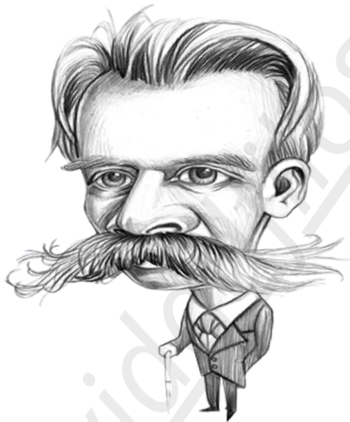
Ilustración: Nacho García.