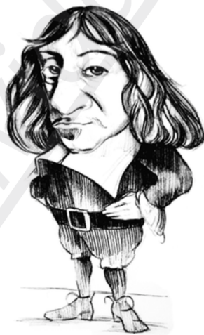
Ilustración: Nacho García